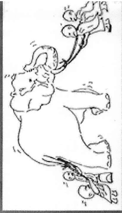
“การทำงานประจำภาคพระพุทธศาสนาของคณะสงฆ์”

คณะสงฆ์วัดโพธิ์ศรีสว่าง บ้านทับใหญ่ มหาวิทยาลัยมหาจุฬาลงกรณราชวิทยาลัย สำนักงานวัฒนธรรมจังหวัดสุรินทร์ องค์การบริหารส่วนตำบลทับใหญ่